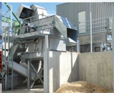
// ОБРАБОТКА СЫРЬЯ