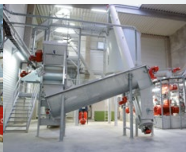
// ТРАНСПОРТНОЕ ОБОРУДОВАНИЕ ГРАНУЛ